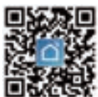
Fig 1-3 Android

Ieškokite "Smartlife" "Apple Store" ar "Google Play" arba naudodamiesi naršykle nuskaitykite aukščiau pateiktą QR kodą (1-2 pav.) ir atlikite paskyros registraciją bei diegimą pagal programėlės nurodymus.