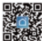
Fig 1-2 IOS